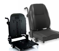
Rücken: ARH 2172 bzw. 2173