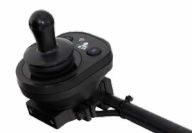
2231 / 2232