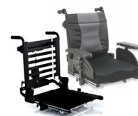
Rücken: ARH 2171