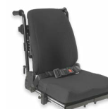
Rücken: ARH 2174, 2175